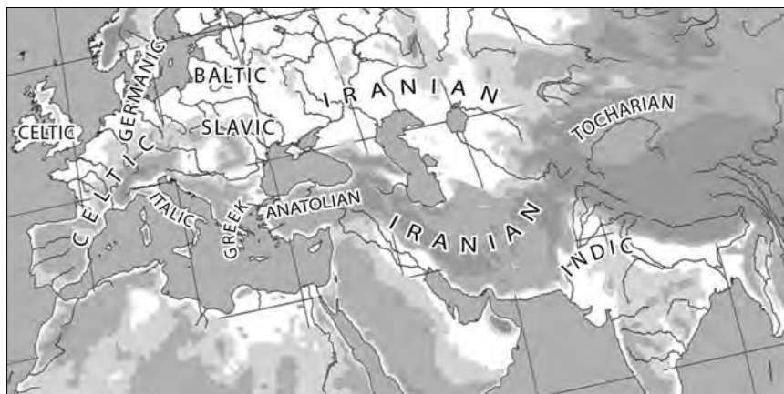
РИС. 1.2. Примерное географическое расположение основных ветвей индоевропейских языков около 400 года до н.э.

служит конструкция предкового корня *kʷntom- . Дочерние формы сравниваются звук за звуком, с рассмотрением каждого звука в каждом слове каждой ветви, чтобы понять, могут ли они сойтись в одной-единственной серии звуков, которая могла эволюционировать во все эти формы согласно известным правилам (я объясню, как это делается, в следующей главе). Эта исходная серия звуков, если она может быть найдена, служит доказательством того, что сравниваемые термины генетически родственны. Реконструированный корень является итогом последовательного сравнения.